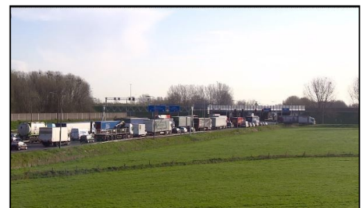
Een van de dagelijkse files op de Maasroute.