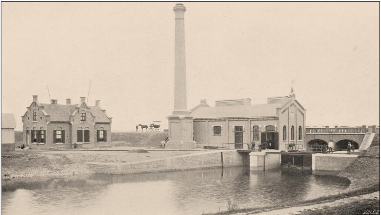
Afbeelding van de Bovenlandse Sluis, het stoomgemaal en de bedrijfswoning in Doeveren na de aanleg ca. 1900.

Door Ad Hartjes, begint om 19.00 uur in het pompgemaal Gansoijen. Opgeven per mail bestuur@hkkonsenoort.nl of telefonisch 0416-320995.