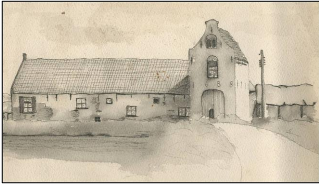
Tekening van het poortgebouw

verruilden veel Heusdenaren hun woning voor een moderne doorzonwoning in Oudheusden. Door de eenzijdige bestuurlijke aandacht voor de restauratie van de vesting verloederde Oudheusden langzaam. Thans wordt een inhaalslag gemaakt.