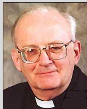
Tiny Muskens, oud-bisschop van Breda

17 april jl. overleed op 77 jarige leeftijd oud-bisschop Tiny Muskens van Breda in een zorgcentrum in Teteringen. Tiny Muskens werd op 11 december 1935 geboren in het kerkdorp Elshout.