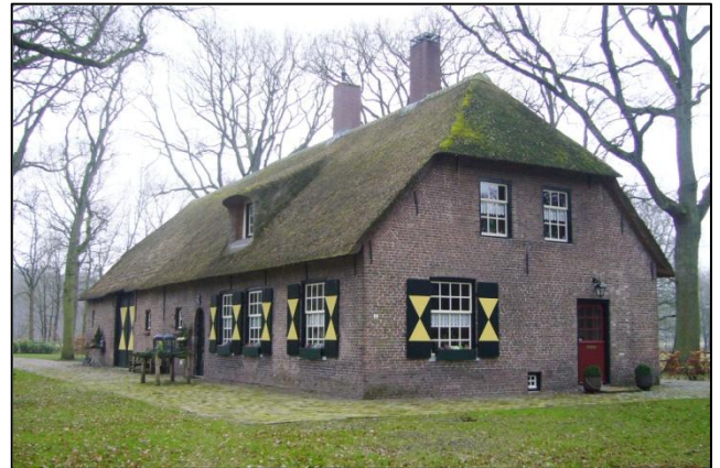
Een van de fraaie boerderijen in Plantloon