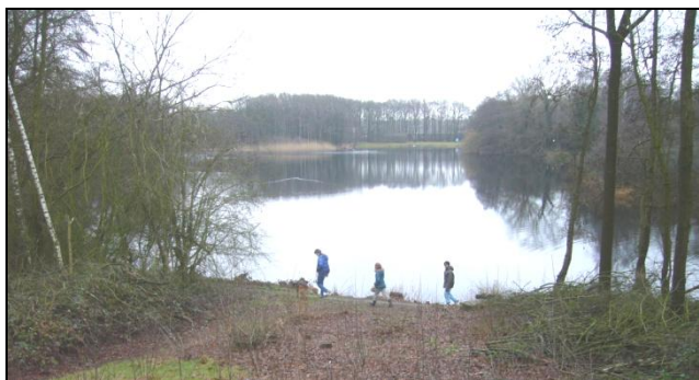
De Nieuwkuijse wiel

Voor de gemeente Heusden is door de Bosgroep Zuid-Nederland een subsidie binnen gehaald voor herstel van de Nieuwkuijse Wiel. De doelstellingen van de herstelmaatregelen zijn het verbeteren van water-, verlandings- en oevervegetaties die bij voedselarme tot matig voedselrijke wateren behoren. Het hoofddoel is herstel en uitbreiding van soorten die bij de oeverkruidklasse behoren zoals oeverkruid, moerashertshooi en zonedauw. Met de uit te voeren maatregelen zal de waterkwaliteit zich herstellen en wordt deze minder kwetsbaar, bijvoorbeeld voor de groei van blauwalg. Daarnaast zal het aantrekkelijker worden om rond de wiel te wandelen en te recreëren. De herstelmaatregelen aan het voormalige zwembad van "Janus van Engelen" en de ligweide zullen zorgen voor verbetering van de recreatieve waarde.