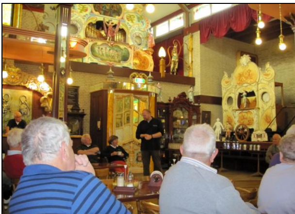
Vele orgels waren te bewonderen in Hilvarenbeek