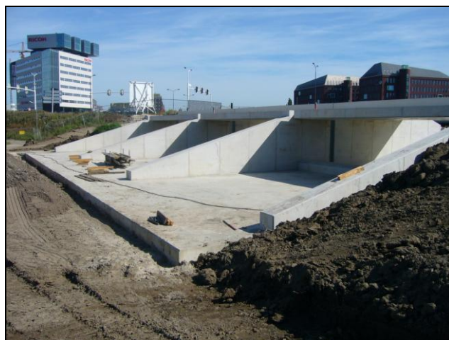
Het HOWABO inlaatkunstwerk nabij den Bosch

Bij langdurige regenval in Frankrijk en België en als er veel smeltwater uit de Ardennen richting Brabant stroomt, kan het waterpeil in de Maas flink stijgen. Voor onze omgeving is dat in principe geen probleem, de maasdijken zijn hoog en sterk genoeg. Maar als het peil van het water in de Maas zo hoog staat dat het water van de Aa en de Dommel niet meer via de Dieze bij spuisluis Crèvecoeur nabij de brug bij Hedel op de Maas kan worden geloosd, kunnen er problemen ontstaan. In 1995 was dit het geval. De dijk van de Dommel brak door en Het Bossche Broek en een deel van de A2 stonden onder water.