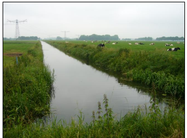
De Luisbroekse Wetering

De Luisbroekse Wetering en een deel van de Hedikhuizensche Maas in de driehoek Haverley, Haarsteeg en Hedikhuizen zijn aangewezen als EVZ's. Hierdoor worden de natuurgebieden de Sompen en Zooislagen en de Haarsteegse Wiel in Haarsteeg verbonden met de oevers van de Maas. Indirect, op een groter schaalniveau, worden als gevolg van de verbindingen zoals die langs de Luisbroekse Wetering en de Hedikhuizensche Maas worden aangelegd, gebieden zoals het Dommeldal, Engelermeer, Moerputten, Vlijmens Ven en Bossche Broek verbonden met de Maas.