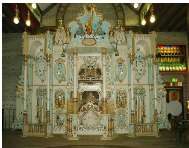
Dit fraaie orgel is te bewonderen in het orgelmuseum in Hilvarenbeek

In het volgende Plekbord komt het inschrijfformulier.