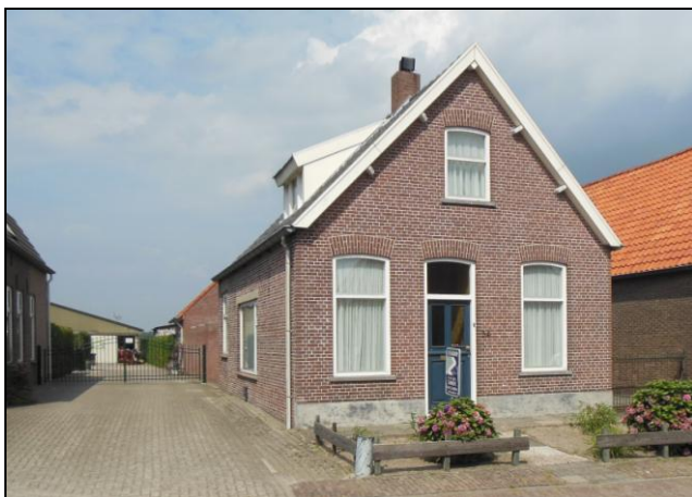
Het pand in Elshout waar het boterfabriekje gevestigd was

Sjef van Hulten, tel: 073 5514390 of 06 4626 4419