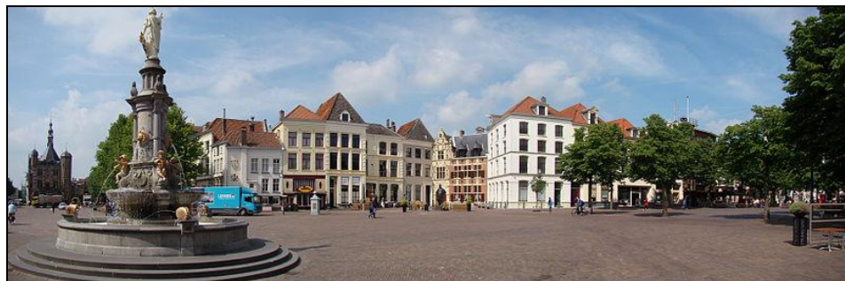
De Brink in Deventer

U kunt zich nog voor de excursie opgeven via de mail of door het strookje op bladzijde 6 in te vullen en op te sturen. Wees er snel bij. We vertrekken om klokslag 8.30 uur vanaf abdij Mariënkroon en zijn rond 19.00 uur weer terug in Nieuwkuijk.