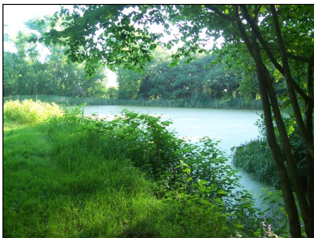
De vervallen eendenkooi in natuurgebied Pax

De Hooibroeken en het landgoed PAX zijn landschappelijk een geheel en liggen tussen Oudheusden en Elshout. Het landgoed PAX is eigendom van en in beheer bij Brabants Landschap. Het grootste deel van de Hooibroeken is eigendom van en in beheer bij Natuurmonumenten. De Hooibroeken en landgoed PAX maken deel uit van een komkleigebied dat vanaf de Elshoutse Zeedijk in oostelijke richting doorloopt tot aan de Haarsteegse Wiel. Het gebied heeft hoge natuur-, landschappelijke en cultuurhistorische waarden.