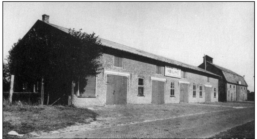
Het veilinggebouw van Vlijmen met rechts de hophloods van de Hopvereniging, waar in de jaren dertig tot aan het begin van de jaren veertig de hop werd opgeslagen en verhandeld. Het gebouw stond in de Stationsstraat ( nu Burg.Zwaansweg). Na het opheffen van de veiling is het in 1965 afgebroken

Reacties graag naar Bas van Andel, 041639-1858 of pomobas@wxs.nl