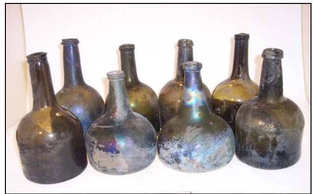
Een fraaie serie flessen gevonden in de gracht van kasteel Onsenoort

De komende maanden zal in dit blad meer gepubliceerd worden over de voortgang van dit project. Meer informatie is bij het secretariaat verkrijgbaar.